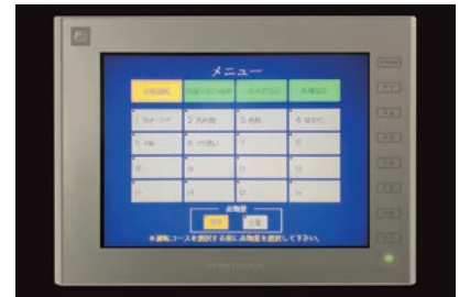
カラータッチパネル