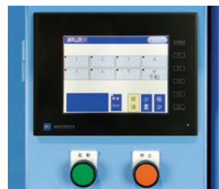
カラータッチパネル