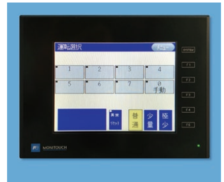
カラータッチパネル