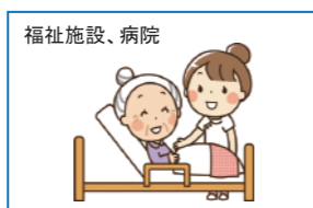
タオル、シーツ、私物など