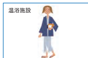
タオル、バスマット、館内着など