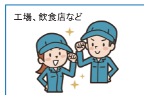
作業着、ユニフォームなど